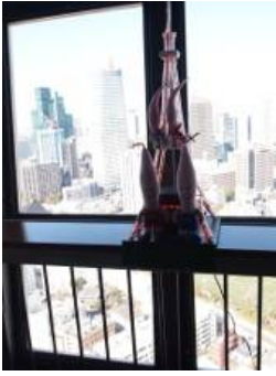
チケット売り場・エレベータの入り口で ノッポンがいましたが、名前は知りませんでした。