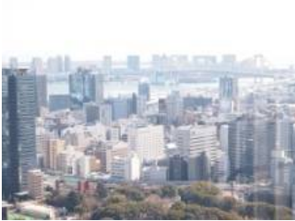
工事中とよく見ていただいても、知っている方 よく来る方には角度からも分かっていただけると 思います。大展望台2階にてで、前に来たのは 小さいときでしたので特別展望台に行ったことが あるかというのもあまり記憶にないです。 3月頃からはそこまで上がれるみたいです。