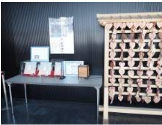
受験の絵馬で志望校の同じ人のがそこに あれば、私も俺もがんばろうと思うことも あるかもしれませんが、もし掛けるときに ハートで同じ対象のものがあつたとしたら どうするのでしょうか。

よく観光名所の柱とか(近くのトイレ) にある落書きをするのを防ぐための場合にも、 それを書いて掛ける所があるというのならいい と思います。そこに落書きで(他人の愛のキュ ーピット)傘とか書くのは。