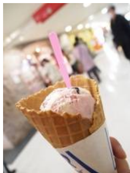
一段落して食事。その時間と店を出てからアイス クリームを食べながらお土産なども見ていたので (冷し胡麻辛うどんと、フレーバー覚えられてい ません)