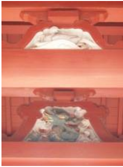
民話がある中門の鴨の彫刻

目つぶしの鴨と坂川治水碑があるということが帰ってから調べてみると分かりました。実際に行ってみたのが先週ということもあり、後で調べたりと書いているので、また訪れないと正確さに欠ける内容もあります。