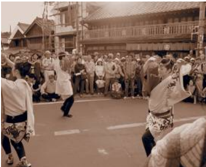
忠敬橋の橋の上で 手踊り 佐原祭遊會です。