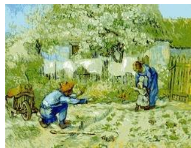
フィンセント・ファン・ゴッホ

自然とは、生活の場であり様々な物語の舞台を与える。芸術、表現、理解があり、展覧会も写実的な風景が中心ということだけでなく、それ以上の具現化や人々の想像、自然に対する関わり、また独自のジャンルを形成し表現として多彩な展開をみます。