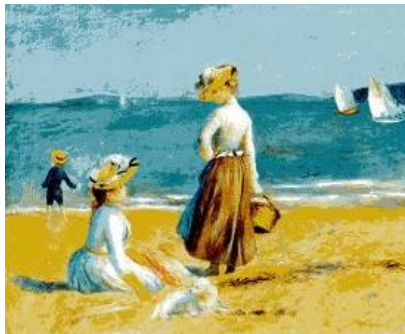
ピエール＝オーギュスト・ルノワール

メトロポリタン美術館は所蔵作品が沢山で、1日で見て回るのも大変ですが、その中から、4000年という長いスパンで、どういうテーマで1.5時間程で見て回れる